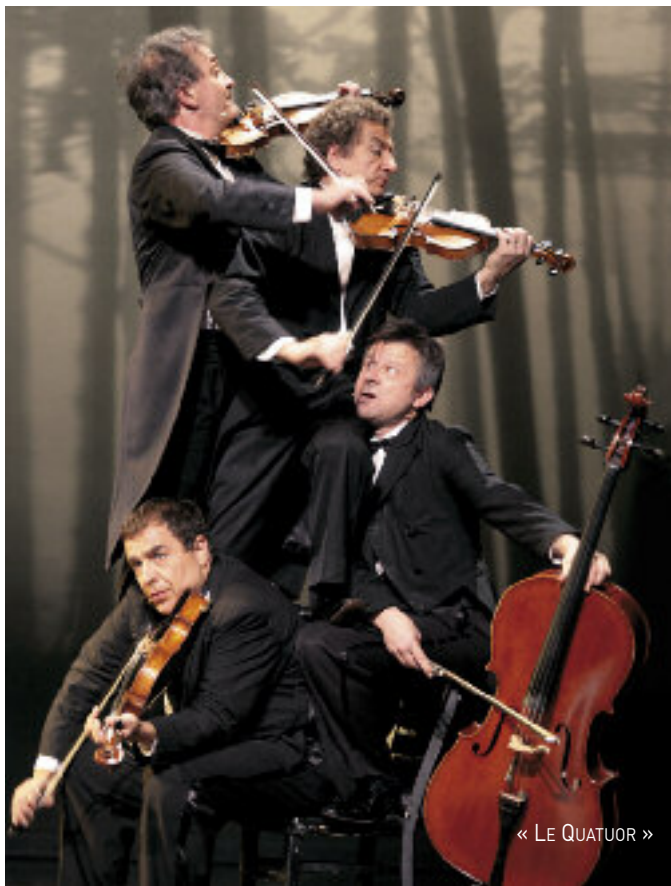
« LE QUATUOR »

OPÉRA : « LE ROI ET LE FERMIER » OPÉRA-COMIQUE DE PIERRE ALEXANDRE MONSIGNY Samedi à 20h et dimanche à 16h