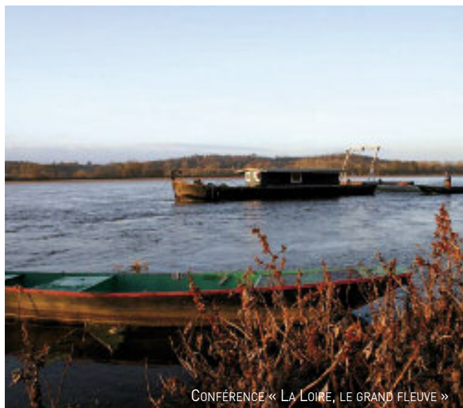
CONFÉRENCE « LA LOIRE, LE GRAND FLEUVE »