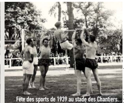
Fête des sports de 1939 au stade des Chantiers.