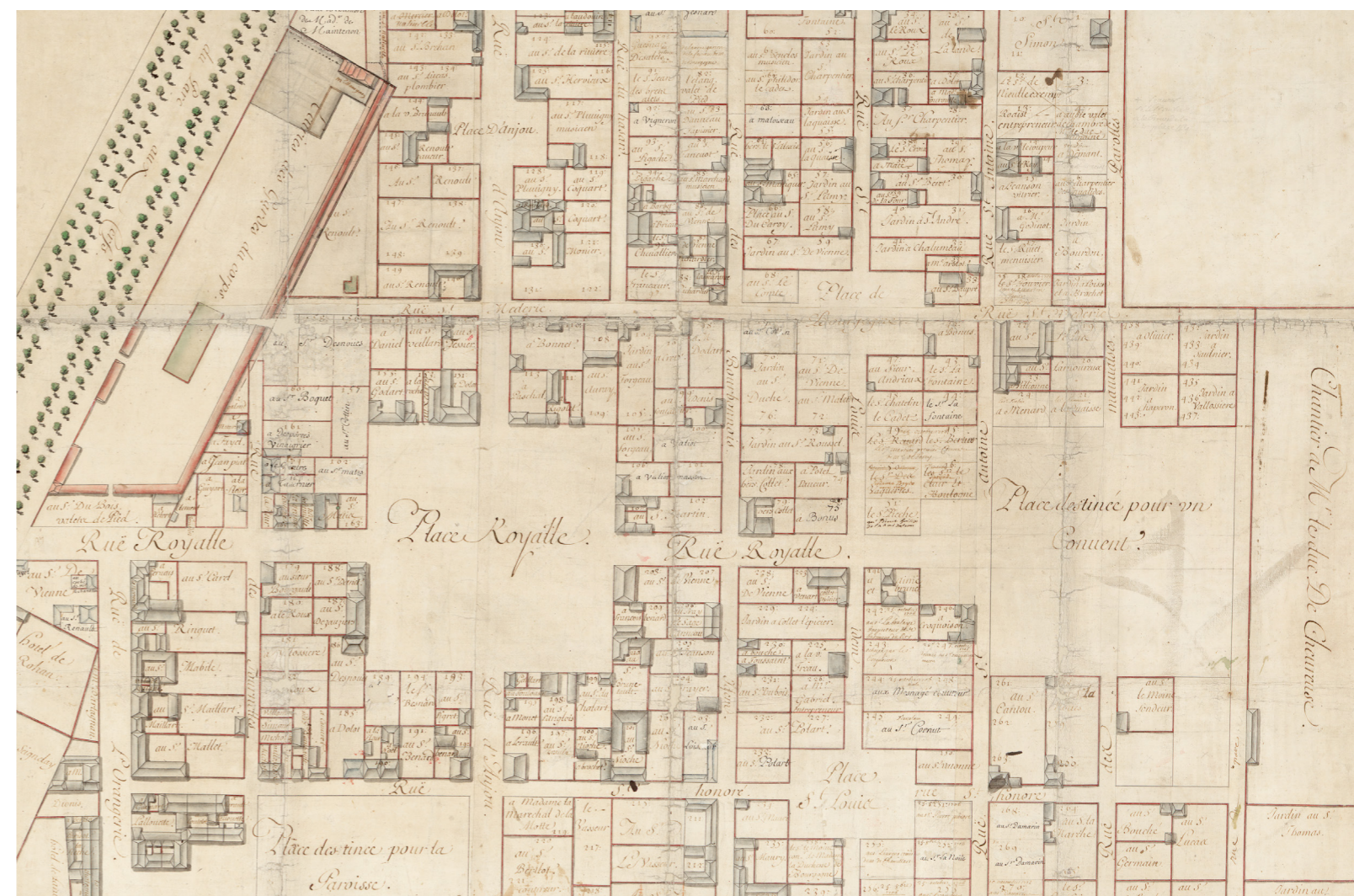
Plan cavalier, numéroté et légendé, du quartier du Parc-aux-cerfs, vers 1700, mis à jour jusqu'en 1708 © Archives nationales.

- Un atlas inédit des bâtiments militaires de Versailles au XIX e siècle, conservé dans les services du ministère des Armées.