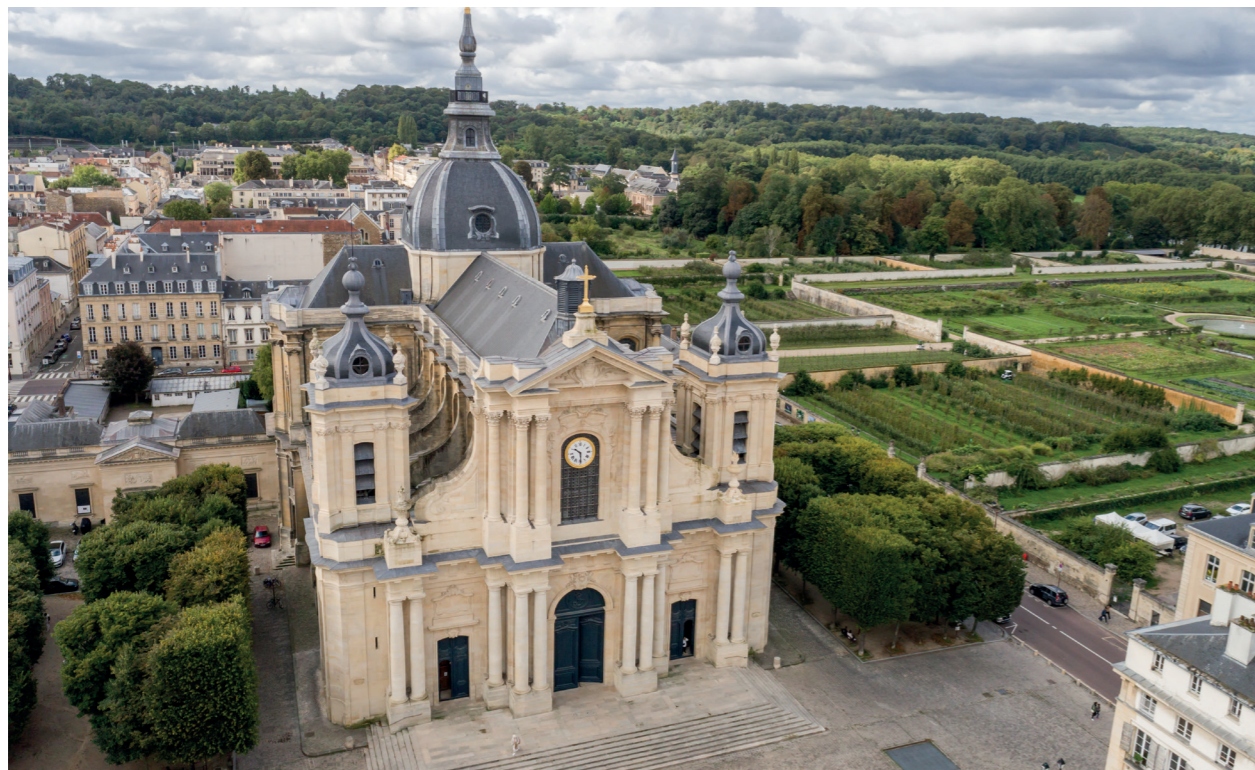
La cathédrale Saint-Louis