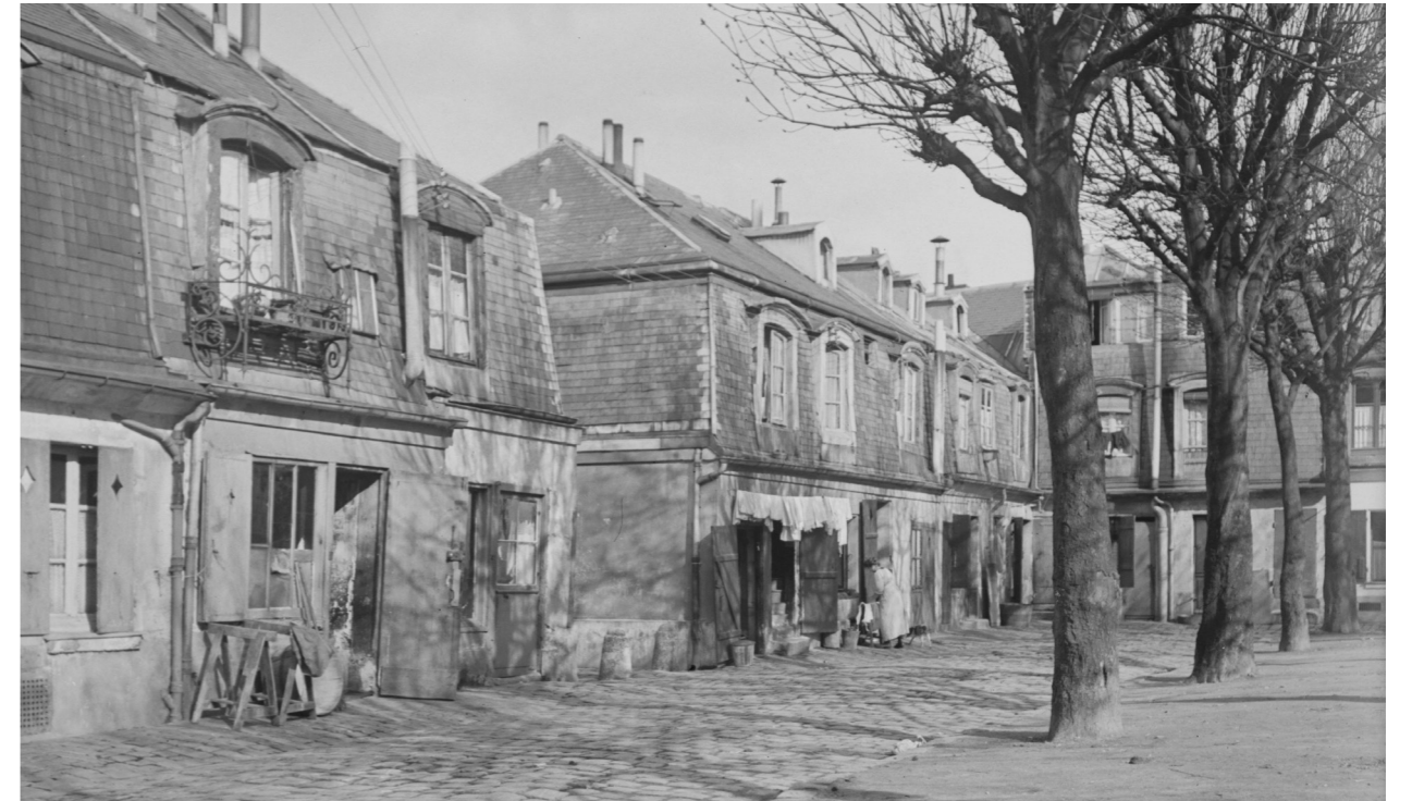
Vue d'un côté des Carrés Saint-Louis au début du XX e siècle. Photographie d'Ernest Baillou © Bibliothèque municipale de Versailles.