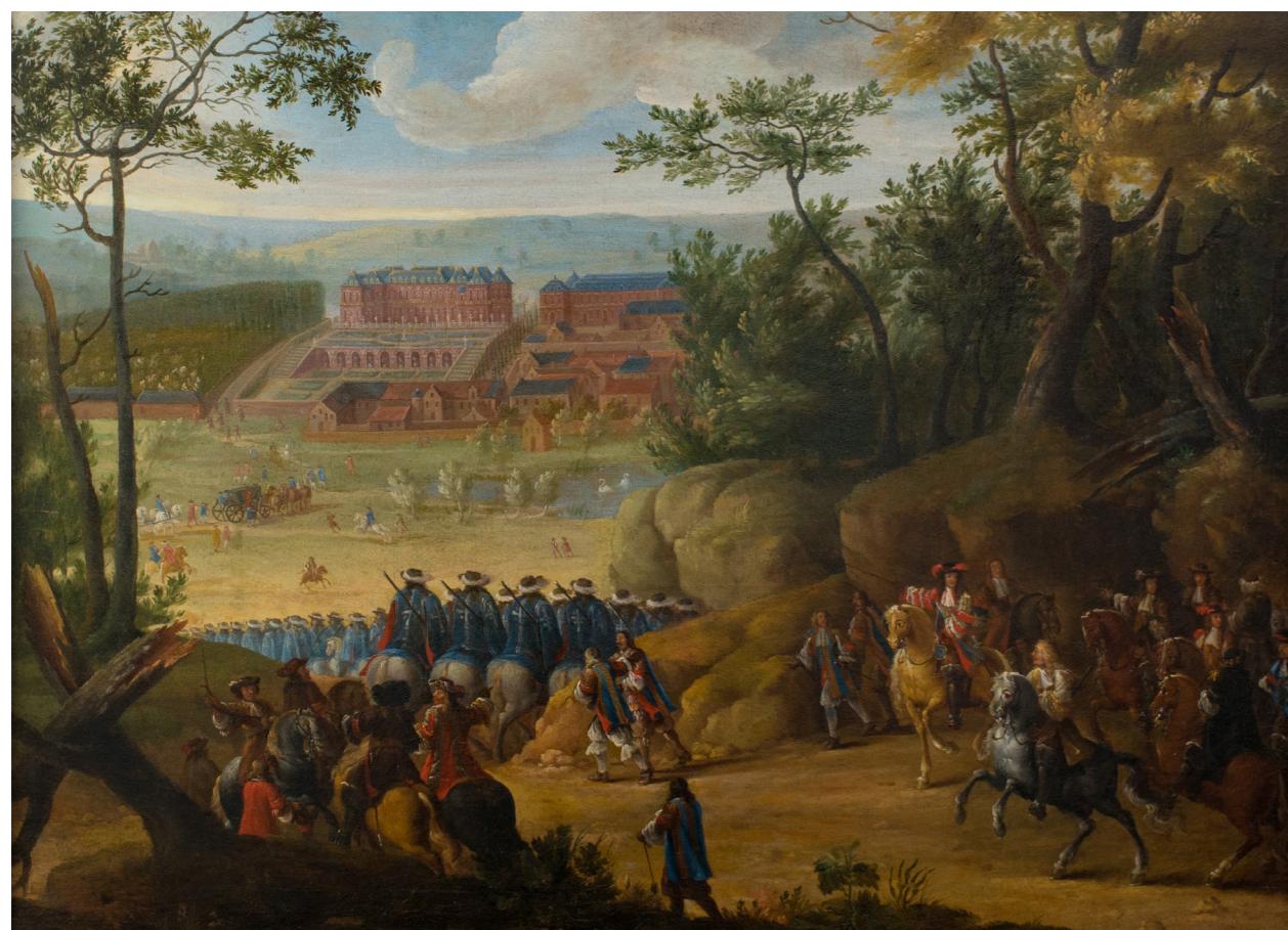
Vue du château de Versailles avec Louis XIV et une compagnie de mousquetaires par Adam Van der Meulen, huile sur toile, 1668 © Musée Lambinet.