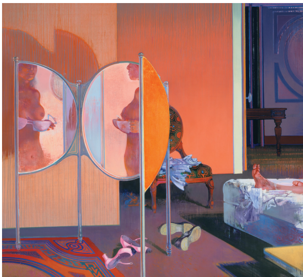
↑ Leonardo Cremonini, Les Sens et les choses , 1968, tempéra et huile sur toile, 195 x 195 cm

Au coin du plein air (1966-1967) ou La Fin de l'été (1969-1971). L'artiste affectionne également des scènes d'intérieur plus intimes, aux coloris acidulés, cadrées par des architectures orthogonales et animées par des jeux de reflets et de compénétrations d'espaces (miroirs, portes et fenêtres ouvertes, pans de mur coupés, vitres reflétant une partie de l'action et brouillant les repères). Par de subtiles allusions et renvois visuels, elles dépeignent souvent les ressorts du désir amoureux, comme dans Les Sens et les choses (1968). Plusieurs œuvres majeures des années 1960 à 1980, prêtées par des musées et des fondations, sont réunies en France pour la première fois depuis plus de trente ans.