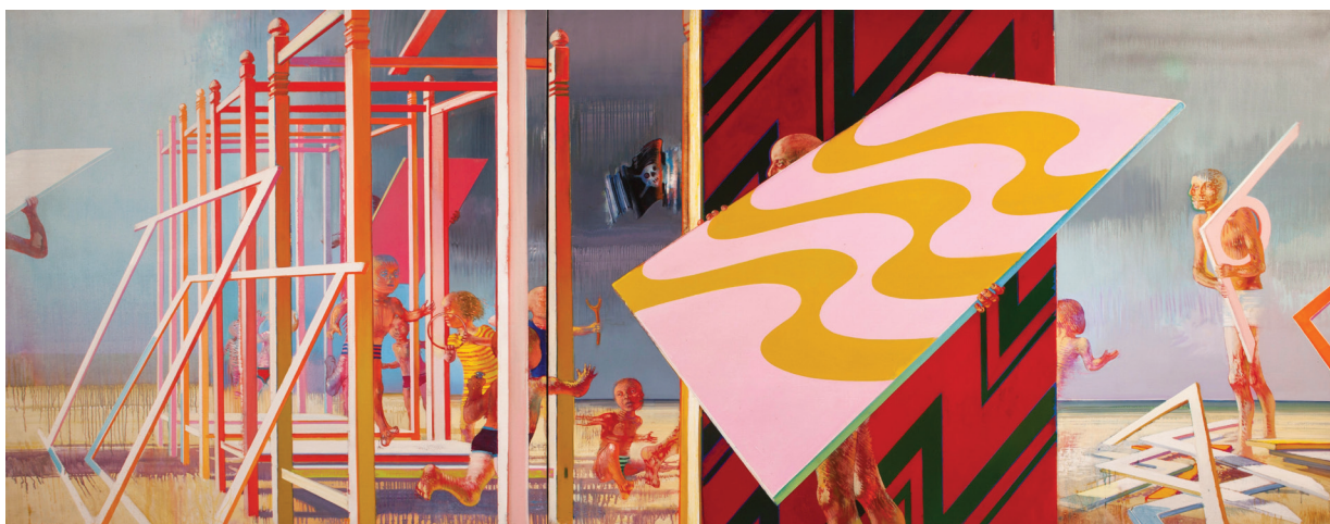
Leonardo Cremonini, La Fin de l'été , 1969-1971, tempéra et huile sur toile, diptyque, 130 x 332 cm, Belgique, collection particulière

Point culminant de sa série des plages, ce vaste diptyque met en scène la fin de la saison balnéaire comme métaphore du passage du temps. Entre démontage des cabines, nuages menaçants et opposition entre enfants joueurs et adultes résignés, l'artiste développe une méditation existentielle sur l'éphémère et la fin de l'illusion.