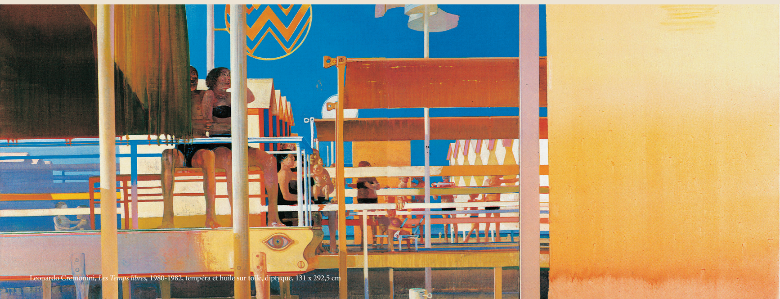
Leonardo Cremonini, Les Temps libres , 1980-1982, tempéra et huile sur toile, diptyque, 131 x 292,5 cm

Leonardo Cremonini : héritage et échos Exposition du 28 septembre au 11 octobre 2026 Carré à la Farine 70 bis, rue de la Paroisse, Versailles Entrée gratuite