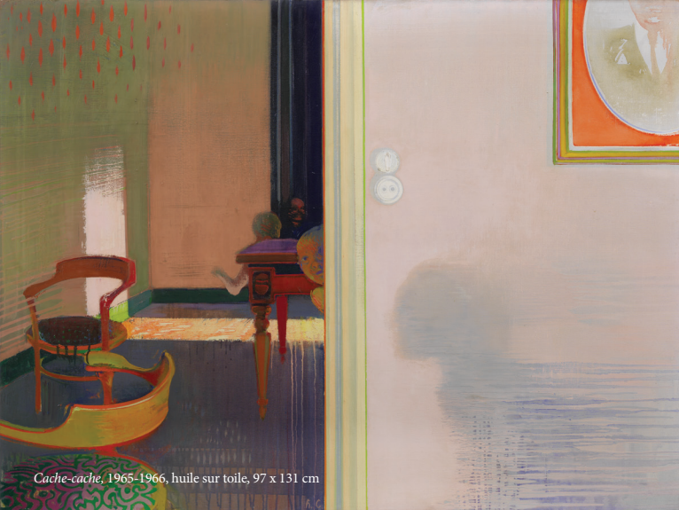
Cache-cache, 1965-1966, huile sur toile, 97 x 131 cm

Le style de Leonardo Cremonini connaît une mutation décisive et rapide au début des années 1960, se dirigeant vers une peinture plus construite et intellectuelle, au goût métaphysique et aux couleurs puissantes, acidulées, marquées par le travail de la texture ; en particulier des couleurs qui rythment l'espace, le dissolvant parfois ou au contraire soulignant sa prégnance. Cadrés entre des structures architecturales orthogonales qui organisent la composition, l'artiste brouille les repères visuels en jouant sur la compénétration des espaces au moyen de miroirs, de portes entr'ouvertes, de balcons et fenêtres donnant sur d'autres horizons ainsi que du hors-champs habilement orchestrés. Dans ce cadre rigide, il campe de nouveaux sujets, plus intimes et en apparence anodins ; scènes de farniente en bord de plage, enfants jouant à l'insu des adultes, couples dans des intérieurs confinés. En réalité, ces scènes cachent souvent un « désordre », représentant un drame sous-jacent mais palpable. À travers elles, l'artiste explore les pulsions et les affects de l'être humain.