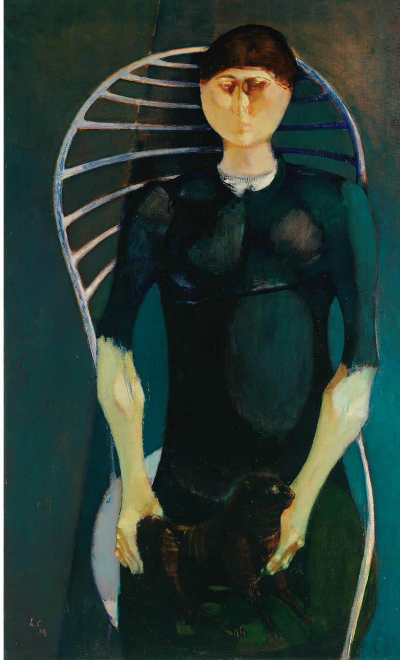
Leonardo Cremonini, La femme au chat , 1954, huile sur toile, 131 x 81 cm

Un ensemble de tableaux de Cremonini représentant des marines prendra place en face de la Marine de Richard Parkes Bonington (1802-1828) et d'une collection de petits formats : entre vues de côtes rocheuses et représentations quasi-abstraites de l'élément liquide, la mer, est un sujet essentiel dans l'œuvre de cet artiste qui passait la moitié de son temps à Paris et l'autre moitié à voyager et à peindre dans des localités maritimes, de la Bretagne à Panarea, d'Ischia à Trouville. Enfin, le cabinet d'arts graphiques du musée présentera l'évolution de l'œuvre graphique de Cremonini en deux accrochages successifs : le public y découvrira d'une part ses dessins à l'encre, datant principalement des années 1950 et parfois dessinés avec un trait acéré qui rappelle celui de la gravure, et, de l'autre, de délicates aquarelles - une technique qu'il affectionne particulièrement et qui devient prépondérante à partir des années 1970. L'aquarelle lui permet de traiter les mêmes sujets que dans ses toiles mais en simplifiant les compositions, en essentialisant les motifs, jusqu'à friser parfois l'abstraction, dans une recherche d'équilibre et de perfection formelle, comme dans Le mur et la mer (1983).