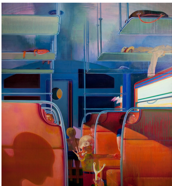
Leonardo Cremonini, Les Tiroirs du voyage , 1977-1978, huile sur toile, diptyque, 237 x 195 cm

Cette œuvre emblématique des années 1950 représente sept femmes conversant en cercle dans une scène intemporelle. Les corps massifs et stylisés, la palette unifiée et la construction monumentale traduisent une recherche d'unité formelle et organique. Cremonini y dépasse la scène de genre pour révéler une architecture secrète du monde, entre humanité et minéralité.