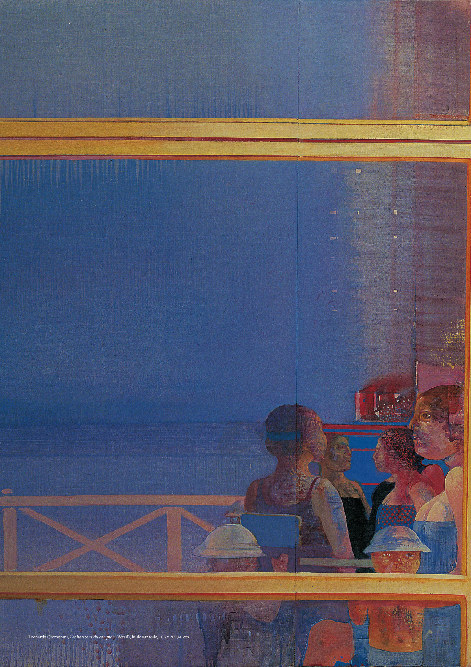
Leonardo Cremonini, Les horizons du comptoir (détail), huile sur toile, 103 x 209,40 cm