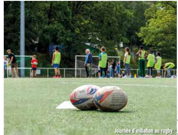
Journée d'initiation au rugby.