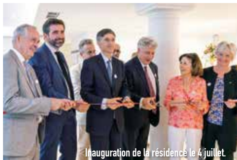
Inauguration de la résidence le 4 juillet.

L'accès aux 24 logements sociaux, spécifiquement dédiés aux seniors est ouvert sur dépôt de dossier au service Logement de la Ville au 01 30 97 80 00.